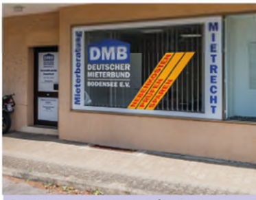
Das Kompetenzzentrum für Mieter: Unsere Beratungsstelle in Radolfzell

Mieter brauchen einen starken Partner, gerade am teuren Bodensee. Sie finden ihn im Deutschen Mieterbund Bodensee. Wir sind die soziale Stimme in unserer Region und bieten Mietern streitbaren Sachverstand. Wenn die Miete steigt, wenn Ihre Wohnung einen neuen Eigentümer bekommt, wenn die Betriebskosten explodieren oder wenn teure Modernisierungen anstehen, helfen wir.